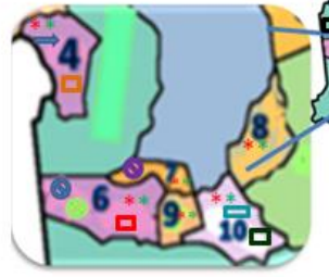
Municipios del Estado de Aragua